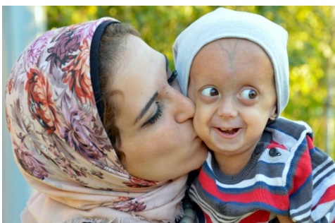
1. Foto ganadora de los Eurordis Photo Awards 2020

Las presentaciones de fotos para el Photo Award 2021 ya están abiertas, hasta el 31 de enero de 2021