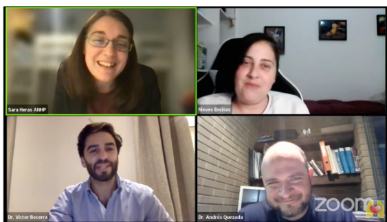
Webinar "Hipertensión Pulmonar: Cuando los tratamientos no son eficaces... Trasplante"

El 16 de noviembre, asistimos a la I Jornada de Salud Comunitaria de la Comunidad de Madrid que se celebró en el Caixaforum y dónde pudimos conocer las líneas estratégicas en cuanto a salud comunitaria de Atención Primaria, así como las experiencias de promoción y cuidados en salud desde las diferentes esferas (escolar, colectivos vulnerables, etc.).