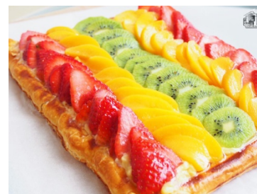
Ilustración 1.

Una plancha de hojaldre, se pincha, se le pinta con clara de huevo y se mete al horno precalentado a 190 grados, 20' aproximadamente. Se deja enfriar.